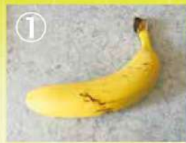
① 房になっているバナナを1本ずつに分けます。

バナナを1本ずつにわけ、それぞれをビニール袋にくるんで冷蔵庫の野菜室に入れるだけで劇的に長持ちするんです!