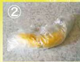
② コンビニやスーパーの買い物袋などに入れ、ぐるぐる巻きにします。