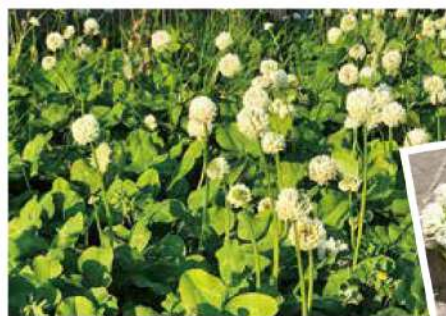
シロツメクサ & クローバーの巻

コロナで自主規制中なので、家の周りを散歩。田んぼの周りにシロツメクサがたくさん咲いていたので、花を摘み、昔作ってた飾りに挑戦。覚えているものですね。できちゃいました!